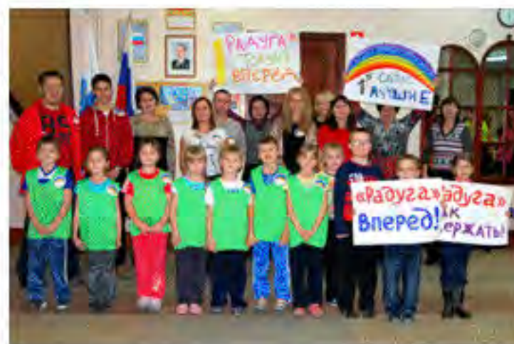
Команда 1б класса