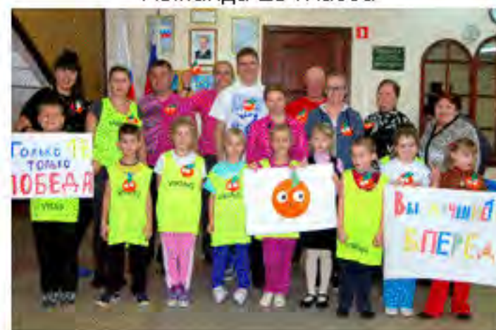
Команда 1в класса