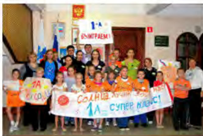
Команда 1а класса

Первоклассники уже практически освоились в стенах нашей школы, активно участвуют в проводимых мероприятиях.